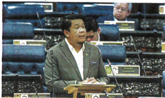
Lukanisman pada Persidangan Dewan Rakyat, semalam.

Beliau menegaskan tujuan utama peningkatan kadar kompaun adalah bagi memastikan kepatuhan lebih baik terhadap peraturan ditetapkan, terutama langkah pencegahan penyakit berjangkit.